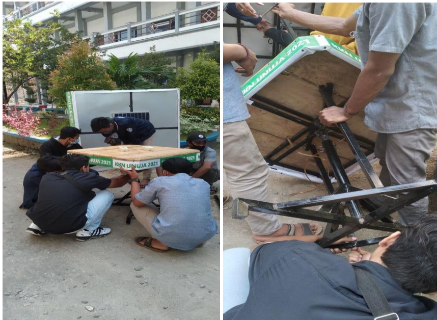
Gambar 4. Perakitan Meja Payung