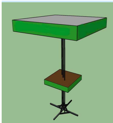
Gambar 3. Design Meja Payung Solar Cell

Untuk design kerangka besi dari meja payung JAYUS bisa di lihat seperti pada Gambar 3, kerangka ini sengaja di buat design yang mudah di bongkar pasang, agar pengguna dapat mebahaw meja payung ini dengan mudah, Atap payung, meja, tiang dan alas kaki dari payung bisa di lepas: (Damara, 2021)