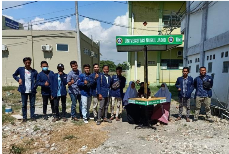
Gambar 6. Foto bersama kelompok pengabdian

pondok, tetapi cukup di dalam pondok, dengan dipandu oleh dosen dan mahasiswa Prodi Teknik Elektro Universitas Nurul Jadid.