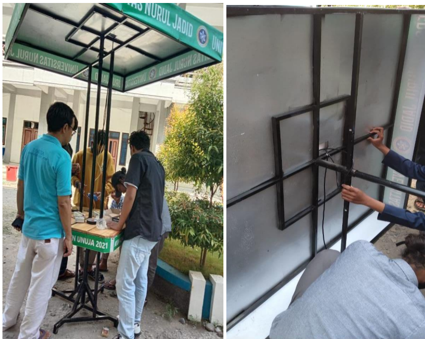
Gambar 5. Instalasi Komponen Solar Cell, SCC dan lampu

Pelatihan instalasi yang dilakukan mulai dari pemasangan meja payung dan pemasangan instalasi solar cell yang terdiri dari komponen yang digunakan dalam meja payung solar cell. Para santri sangat antusias dalam mengikuti pelatihan tersebut, karena bagi mereka ini merupakan pengetahuan baru dan tidak perlu jauh jauh belajar keluar