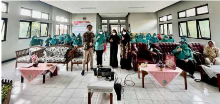
Gambar 6. Kegiatan Penguatan Green Logistics melalui Nilai Ekonomis Sampah Produksi Rumah Tangga (2)