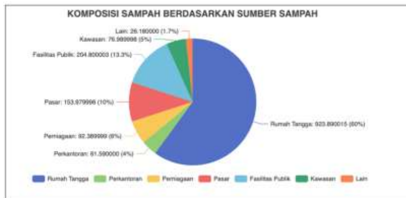
Gambar 2. Komposisi Sampah Berdasarkan Sumber Sampah (SISPSN, 2021)

Pada Gambar 1, menunjukkan bahwa komposisi jenis sampah di Kota Bandung tahun 2020 didominasi oleh sisa makanan sebesar 44,52% dan plastik 16,7%. Pada