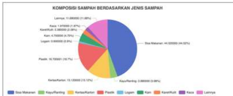
Gambar 1. Komposisi Sampah Berdasarkan Jenis Sampah (SISPSN, 2021)

Tahun 2022, Dinas Lingkungan Hidup dan Kebersihan Kota Bandung menargetkan 30% timbunan sampah di Ibu Kota Provinsi Jawa Barat bisa diolah sehingga tidak akan masuk ke tempat pemrosesan akhir. Salah satu caranya adalah dengan mengembangkan kawasan bebas sampah hingga skala kelurahan (Rizaldi, 2021). Berdasarkan data Sistem Informasi Pengelolaan Sampah Nasional (SISPSN) tahun 2020 Kabupaten Bekasi menempati posisi tertinggi pertama untuk timbunan sampah harian sebesar 1.900 ton/hari, posisi kedua Kota Depok sebesar 1.565 ton/hari, dan posisi ketiga Kota Bandung sebesar 1.539,82 ton/hari (SISPSN, 2021) dengan komposisi sampah dan sumber sampah. Hal tersebut ditunjukkan pada Gambar 1 dan Gambar 2.