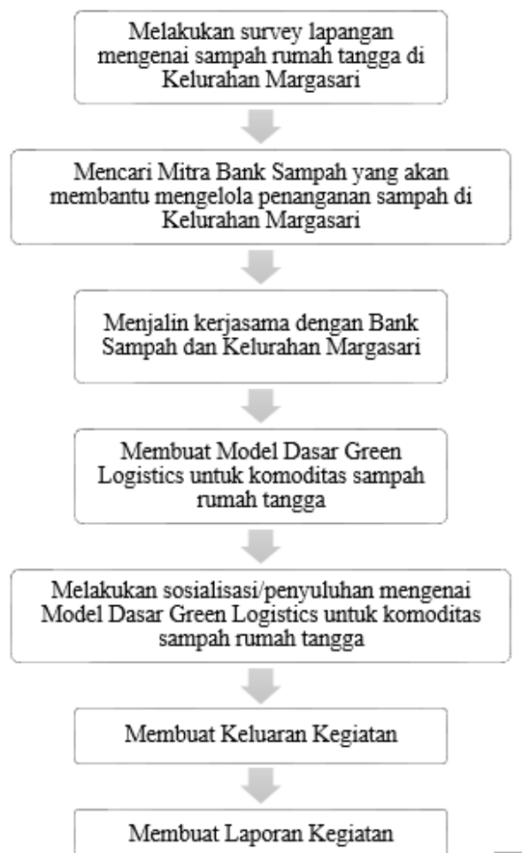
Gambar 3. Metode Pelaksanaan Kegiatan PKM

Metode pelaksanaan kegiatan PKM ini menggunakan metode sosialisasi/ penyuluhan dan pendampingan secara langsung di Kelurahan Margasari Kota Bandung. Tahapan pelaksanaan kegiatan ini dapat dilihat pada Gambar 3.