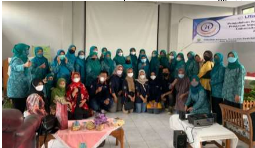
Gambar 7. Kegiatan Penguatan Green Logistics melalui Nilai Ekonomis Sampah Produksi Rumah Tangga (3)

Pemahaman masyarakat mengenai pengelolaan sampah diukur menggunakan beberapa Indikator. Pencapaian setiap indikator dianggap berhasil jika terdapat kenaikan tingkat pemahaman masyarakat, berapapun besaran kenaikannya. Asumsi ini digunakan karena sebelumnya belum tersedia data terkait tingkat pemahaman masyarakat Kelurahan Margasari terhadap pengelolaan sampah rumah tangga.