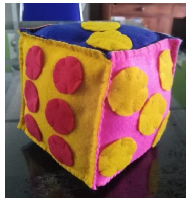
Gambar 1. Desain Ular tangga Matematika dan Dadu