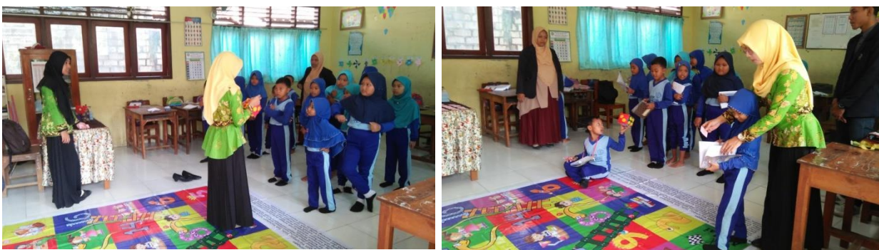
Gambar 2. Penerapan Ular Tangga Matematika dalam Pembelajaran di Kelas

Berdasarkan hasil wawancara yang dilakukan dengan guru, sebelumnya guru belum pernah melakukan pengajaran dengan menggunakan media pembelajaran alat permainan edukatif. Selama ini, guru hanya menggunakan metode pembelajaran langsung atau ceramah dan buku teks berhitung yang membuat siswa jenuh dan kurang antusias dalam kegiatan pembelajaran. Oleh karena itu, guru sangat antusias dengan adanya media ular tangga matematika ini karena dapat meningkatkan kemampuan berhitung siswa. Berikut ini adalah dokumentasi penerapan ular tangga matematika dalam pembelajaran di kelas.