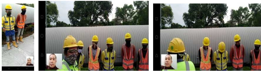
Gambar 2. Dokumentasi Pekerja Yang Telah Memakai APD

Kegiatan sosialisasi K3 ini tim pengabdian kepada masyarakat menjelaskan Alat Perlindungan Diri (APD) apa saja yang harus digunakan untuk pencegahan KAK. APD meliputi helm safety untuk melindungi kepala dari benda - benda, safety belt untuk alat pengaman jika menggunakan alat transportasi, sepatu karet (sepatu boot) untuk alat pengaman yang bisa dipakai di tempat berlumpur atau becek, sarung tangan untuk melindungi tangan saat bekerja di tempat yang dapat mengakibatkan cedera tangan, penutup telinga (Ear Plug / Ear Muff) untuk melindungi telinga pada saat bekerja di tempat yang bising, kaca mata pengaman (Safety Glasses) untuk melindungi mata ketika bekerja, dan masker (Respirator) untuk penyaring udara yang dihirup saat bekerja di tempat. Penyediaan di area lokasi kerja seharusnya menyiapkan persediaan APD, kotak P3K, rambu rambu K3. Selain itu itu perlu dilakukan tahapan jadwal training baik dilokasi maupun yang tersertifikasi agar semakin terlatih dalam menjalankan aktifitas kerja sehari hari.