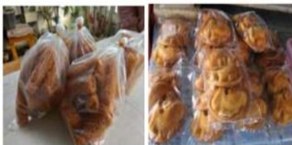
Gambar 3. Permasalahan Logo>Nama Merek dan Kemasan Produk

Sejumlah hasil penelitian sebelumnya menekankan bahwa adanya logo/merek dan desain kemasan dapat memperkuat daya saing suatu produk untuk berkompetisi dalam pasar sarannya (Elango & Thansupatpu, 2020; Khan, K., & Panwar, 2019; Luffarelli et al., 2019; Mukdin & Heryanti, 2020; Undang-Undang, 2016). Oleh karena itu, untuk dapat bersaing terutama dengan produk-produk sejenis, produk Mitra harus memiliki logo/merek dan desain kemasan yang menjadi identitas uniknya.