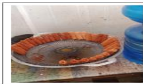
Gambar 2. Produk keukarah

Kesehariannya para anggota memiliki usaha yang beragam, seperti menjual sayur lauk-pauk, kue basah, mencuci pakaian dari rumah ke rumah, usaha pulsa listrik dan lain-lain, yang semua itu mereka lakukan untuk dapat memenuhi kebutuhan sehari-hari dan membantu perekonomian keluarga. Pada bulan oktober tahun 2018 muncul ide untuk memunculkan kelompok usaha bersama (KUBE) ‘Merah’ sebagai bentuk pelestarian makanan khas aceh yang dinilai sudah langka tapi masih banyak peminatnya. Diversifikasi usaha yaitu usaha kue khas aceh seperti keukarah, bhoi, asam kana, dan sepit yang selalu diminati oleh masyarakat aceh sebagai pendamping minuman kopi aceh.