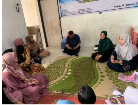
Gambar 4. Kegiatan pendampingan

diskusi-diskusi terkait logo atau label kemasan untuk produk keukarah, diskusi dilakukan secara tatap muka maupun melalui online antara lain telepon atau whatsapp .